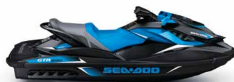
GTR 230 ALTO DESEMPENHO COM MÁXIMO VALOR