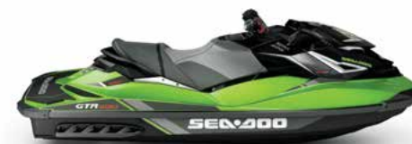
NOVO GTR-X 230 ALTO DESEMPENHO E ALTO VALOR EM UM NOVO MODELO