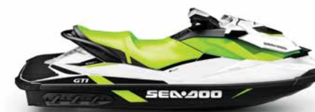
GTI ESTILO, ESTABILIDADE E MUITA DIVERSÃO