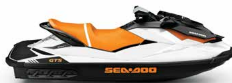
GTS* ESPAÇO PARA TRÊS, DIVERSÃO PARA TODOS